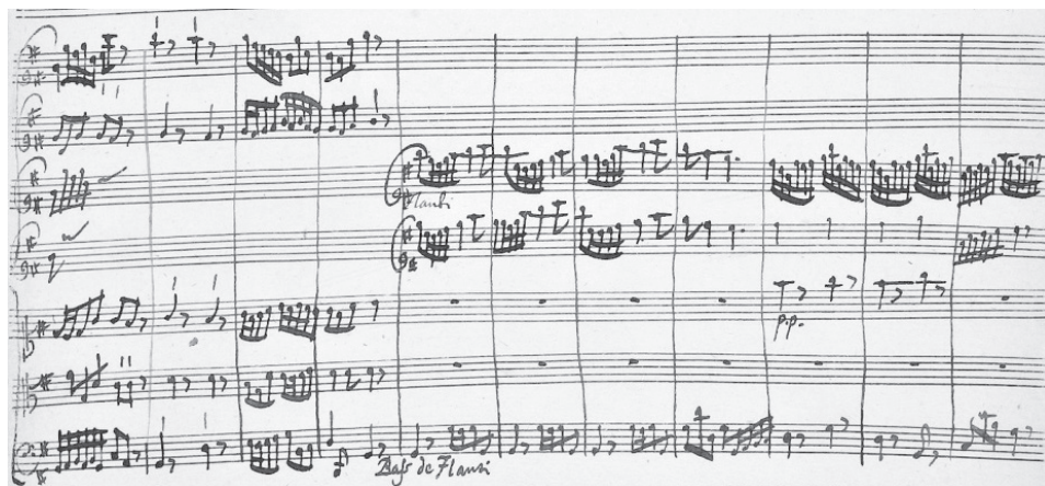
Obr. 3: Rukopis koncerta grossa – označení „Bass de Flauti“, zdroj: http://vmirror.imslp.org/files/imglnks/usimg/8/8e/IMSLP380932-PMLP371320--Mus-Ms-240-06-_Concerto_S.215.pdf

V koncertu grossu Johanna Davida Heinichena: Concerto à 2 Violini ò Flauti G dur , označovaném také jako Drážďanský koncert G dur S. 215 , najdeme zobcové flétny jak mezi sólisty, tak i v orchestru. Dílo je psané pro obsazení dvě altové zobcové flétny, dva hoboje, dvě violy a basso continuo 309 – kombinaci využívanou Scarlattim a ostatními skladateli. 310 V partituře nacházíme občasné označení „Bass de Flauti“ a „Basson“, které se vyskytuje během sóla zobcových fléten a hoboje. S velkou pravděpodobností je tím myšlené, že spolu se zobcovými flétnami má hrát ještě basová zobcová flétna a spolu s hoboji fagot. V koncertu sledujeme tedy specifický efekt tří instrumentálních skupin – první je celý orchestr jako jedna skupina, druhý jsou zobcové flétny spolu s basovou a třetí je skupina hoboje s fagotem. Zobcové flétny se poprvé objevují až ve druhé větě Vivace , kdy jsou doprovázeny právě basovou zobcovou flétnou. Třetí věta je pro sólové housle za doprovodu bassa continua, zobcové flétny se zde nevyskytují. Sólové role se jim dostává až ve čtvrté větě Vivace .